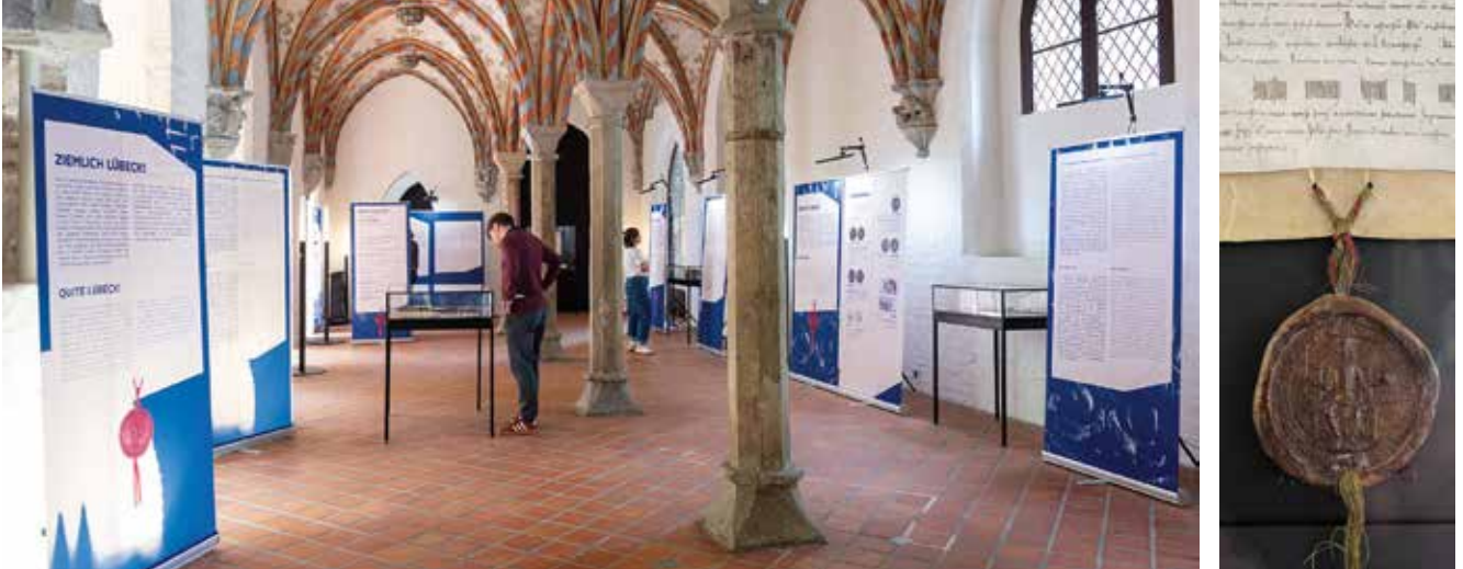
Links: Blick in die Ausstellung im Kapitelsaal des Burgklosters; rechts: Siegel am Reichsfreiheitsbrief.

Im Frühling des Jahres 1226 machen sich Lübecker Ratssendboten auf den Weg nach Italien, um sich von Friedrich II. das von dessen Großvater Barbarossa 1188 ausgestellte Privileg bestätigen zu lassen. Dass die Männer eine zu Gunsten der Stadt veränderte Abschrift – also eine Fälschung – mit sich führen, bleibt unbemerkt. Wieder in Lübeck, haben sie nicht nur die ergatterte Bestätigung im Gepäck, sondern in zweifacher Ausfertigung auch das Dokument, mit dem Lübeck zur Handelsmetropole Nordeuropas gedeiht: den Reichsfreiheitsbrief, der Lübeck zu einem eigenständigen, nur dem Kaiser unterstellten Staat macht und erst 1937 mit dem Groß-Hamburg-Gesetz nichtig wird. Jahrhundertlang ist das Dokument die wichtigste Lübecker Verfassungsurkunde. Im Jubiläumsjahr ist nun eines der zwei Exemplare im Rahmen der vom Archiv der Hansestadt Lübeck kuratierten Ausstellung „Ziemlich privilegiert! Lübeck und die Reichsfreiheit“ im Kapitelsaal des Burgklosters zu sehen. Und wer immer noch denkt, dass das Mittelalter bloß Geschichte ist, wird eines Besseren belehrt.