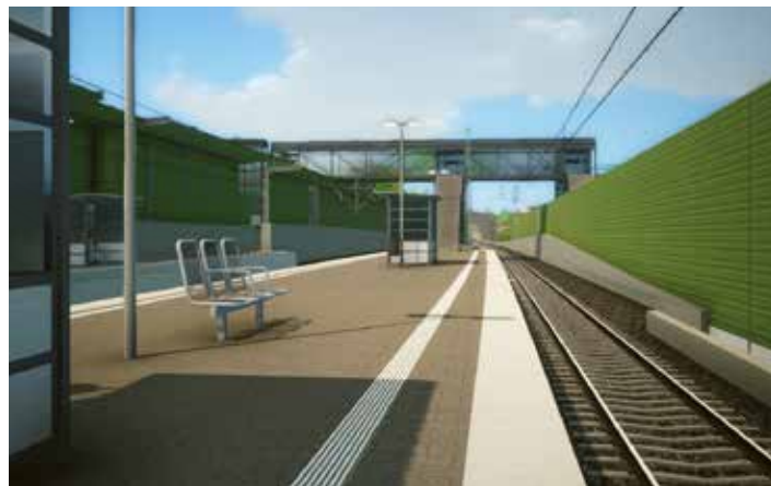
So soll der neue Bahnsteig aussehen.

Breiten Raum nahm in der Diskussion die neue Kaltenhöfer Brücke ein. Auf die kritisierten Mängel gab es für die Fragesteller nur eine Antwort: Erst wird gebaut, dann