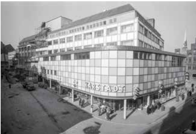
Karstadt-Erweiterung bis zur Königstraße, 1961.