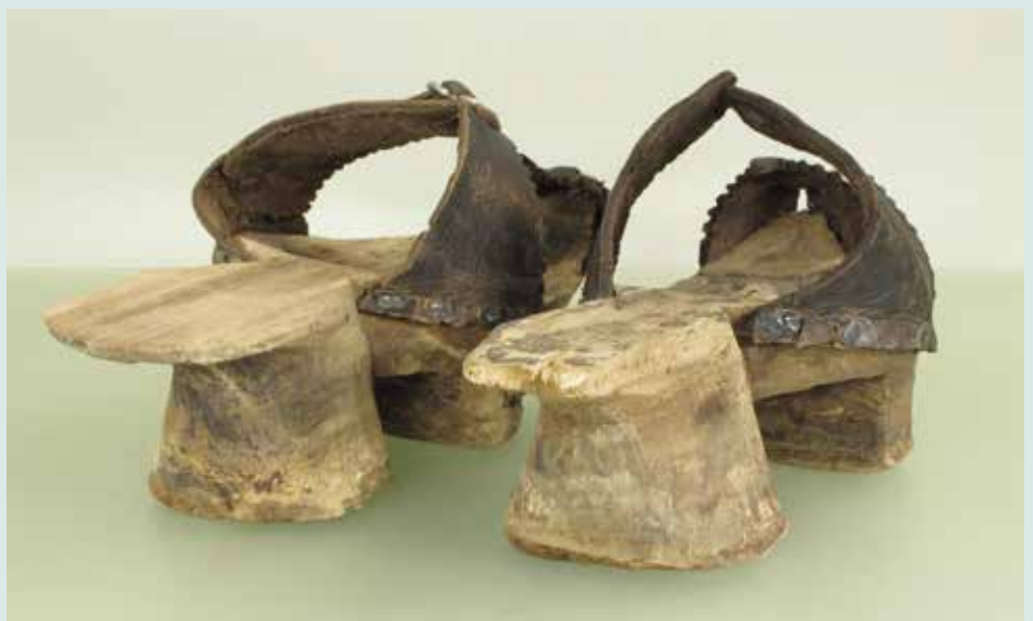
Auch die Konservierung dieser hölzernen Überschuhe (Trippen) aus dem 15. Jahrhundert, gefunden auf einem Grundstück in der Beckergrube, wurde möglich durch die finanzielle Unterstützung der Archäologischen Gesellschaft.