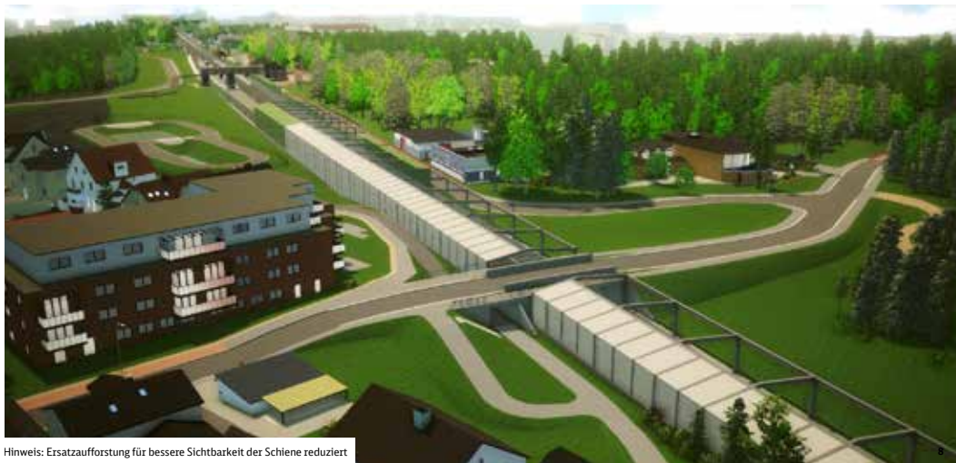
Projektskizze der Straßenbrücke Kaltenhöfer Straße.