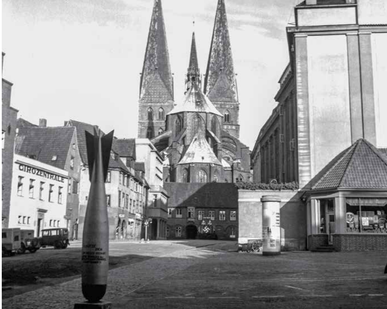
Der Schrangens um 1940. Links Fassaden der „Altstadtverbesserung“, Parkplätze und eine Fliegerbombe als Werbung für den Luftschutz, rechts die Tankstelle.