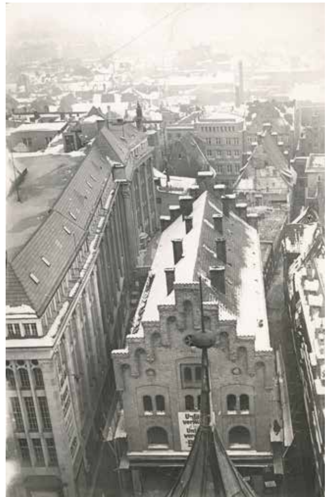
Abbruch der Schrangens-Bebauung, Winter 1928/29. Im Vordergrund das Spritzenhaus von 1852.