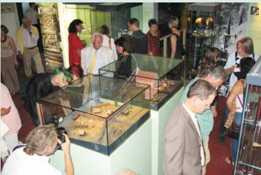
Mit der Eröffnung des Archäologischen Museums im Burgkloster im Juli 2005 wurde ein großer Traum Wirklichkeit. Er dauerte jedoch nur fünfeneinhalb Jahre. Die Forderung nach einem Museum für die vielen wertvollen, in Lübeck geborgenen Artefakte bleibt weiterhin bestehen.