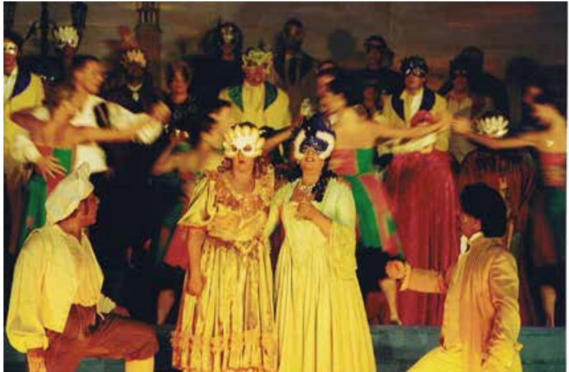
Die Lübecker Sommeroperette entführt das Publikum auch in dieser Saison nach Venedig.

Halbtagsrundwanderung ab Bhf. Pönitz, ca. 10 km, mit Anja Fingerhut-Fenner, Initiatorin des Naturkundepfades Gleschendorf, und Besichtigung der Beobachtungsstation, Rucksackverpflegung, Einkehrmöglichkeit am Ende bei Bäcker Brede. Treffen: 9.10 Uhr Bahnhofshalle/