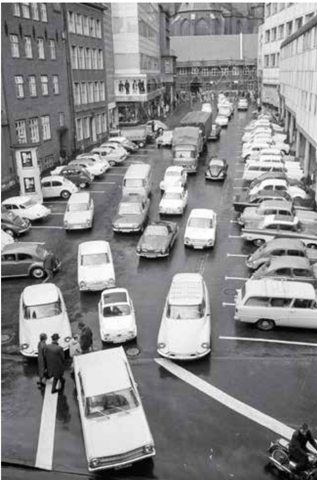
Der Schrangenseite als Teil der autogerechten Stadt, 1965.

„Altstadtverbesserung“ zur Neugestaltung einiger Fassaden auf der Südseite, dort, wo heute das Übergangshaus steht. Vor diesen Häusern – teils von der Stadtkasse und einer Bank genutzt – gab es erste Parkplätze für Pkw. Auf der Freifläche unterhalb des Karstadt-Blocks entstand eine Tankstelle.