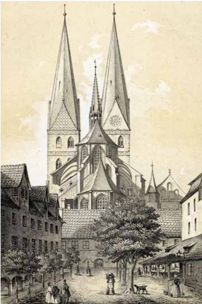
Der Schrangens 1847, Lithografie nach einer Zeichnung von Carl Julius Milde.

Carl Julius Mildes Zeichnung von 1847 zeigt noch die „Fleischschrangens“, die überdachten Verkaufstische der Schlachter, nach denen der Schrangens seinen Namen trägt. Ebenfalls zu sehen sind noch zwei Reihen von Bäumen. Die nördliche Reihe (rechts im Bild) spendete im Sommer Schatten – wichtig beim Verkauf verderblicher Ware. Der untere Teil des Schrangens war bebaut, zwei kleine Gassen (Alter Schrangens im Norden und Kleiner Schrangens im Süden) führten an den Buden und einem großen, zur Königstraße hin gelegenen Haus vorbei.