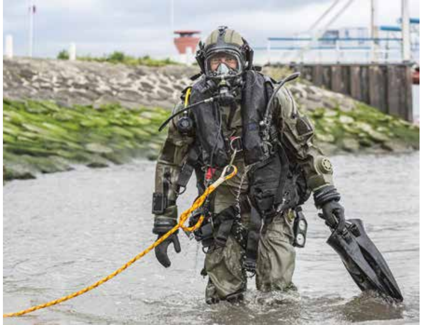
Übungseinsatz einer Spezialeinheit in der Ostsee.

mittelbar präsent. Beim Rundgang sieht man weitere Taucheraufgaben im Dienst der Hansestadt Lübeck, wie Unterwasserarchäologie (Hebung eines Wracks aus dem 17. Jahrhundert) oder Einsätze zur Kartierung und Bergung von gefährlicher Altmunition und chemischen Kampfstoffen in der Ostsee. Auch Forschungen zur Meeresbiologie, etwa Planktonuntersuchungen, und zum Umweltschutz, Plastikmüll und „entsorgte“ Fischerei-Utensilien, sind fotografisch dargestellt. Parallel dazu sind Werkzeuge, Exponate zur Sauerstoffversorgung und Sicherheit der Taucher und einige Original-Taucheranzüge mit Zubehör zu sehen. Ergänzend bieten Zeichnungen eine geraffte Geschichte der Tauchtechniken von der Antike bis zur Gegenwart und Plakate Hinweise auf die Taucher-Profession in Filmen und Literatur. Weiterhin gibt es Informationen über den Tauchsport, Taucherfirmen in Lübeck und Taucherbiografien (Heinrich Prehn, Dieter Harfst u.a.), Menschenrettung bei Unfällen (Feuerwehr), sowie Materialien zum Taucherberuf – Lehrbücher zur Aus-