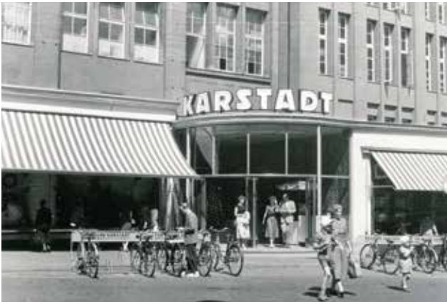
Karstadt-Eingang am Schrangenseite, 1950er-Jahre