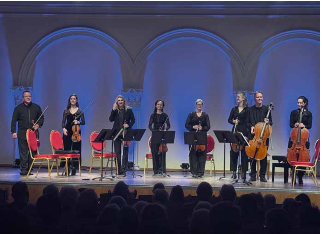
Die Musiker des Philharmonischen Orchesters zeigten sich erneut bestens aufeinander eingestimmt.