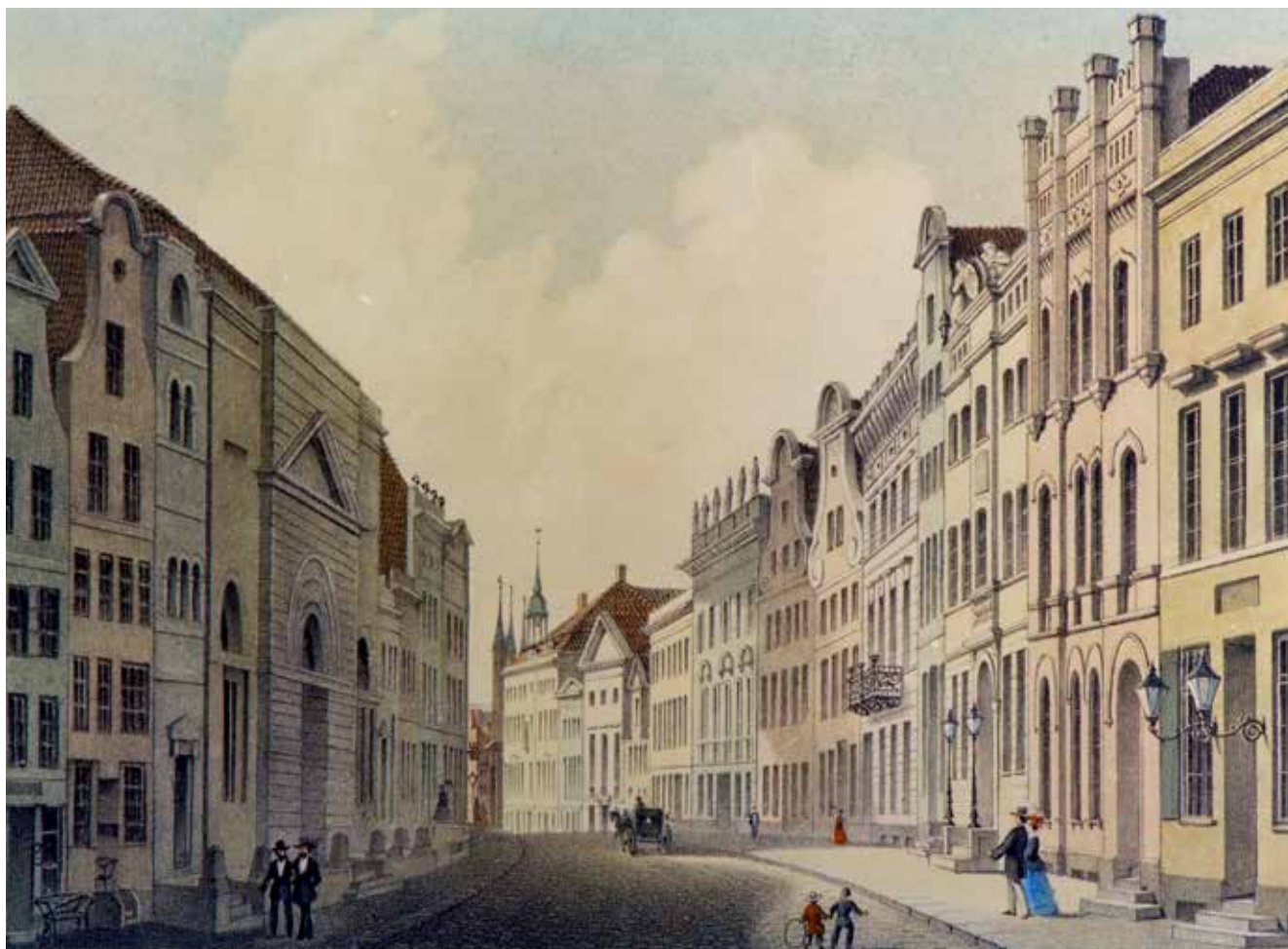
Das ehemalige Kaufmannspalais im klassizistischen Ensemble der oberen Königstraße (auf der linken Seite mit dreieckigem Giebel in der Fassade) ist seit 1826 Versammlungshaus der Reformierten. Die Abbildung zeigt eine Kreidelithografie nach Wilhelm Heuer von 1855.

Seit 1666 existiert eine kleine reformierte, also an Calvin und Zwingli orientierte, Gemeinde in Lübeck. Doch erst 1826 – vor 200 Jahren – kann sie in die Innenstadt ziehen. Warum erst dann und durch welche Umstände?