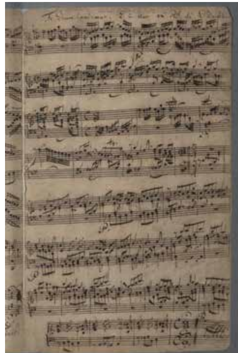
Beginn des „Te Deum“-Manuskripts