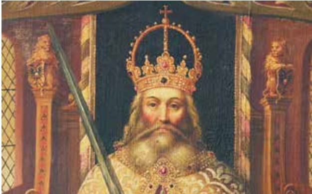
Ausschnitt des Kaiserbildes aus der Königstraße mit den Darstellungen von Doppeladlern links und rechts vom Haupt des Kaisers am oberen Ende der Thronwangen.

Der Beitrag im Heft 8 der Lübeckischen Blätter vom 25. April (S. 114-116), „Das Kaiserbild aus der Königstraße“, hat ein erfreuliches Echo gefunden. Es gab aber auch Wünsche nach Ergänzungen und Berichtigungen. Eine Leserin wünschte sich, die Darstellung des Doppeladlers an den Thronwangen auf dem Kaiserbild sollte besser zu erkennen sein.