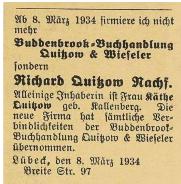
Kulturelle Gleichschaltung: Die Buddenbrook-Buchhandlung zeigt im Börsenblatt ihre Umbenennung an.

Die öffentliche Bücherverbrennung war und blieb eine einmalige Parteiaktion für Lübeck. Als viel wirksamer und langfristiger erwies sich die Aussonderung von Büchern durch die öffentlichen Bibliotheken und die administra-