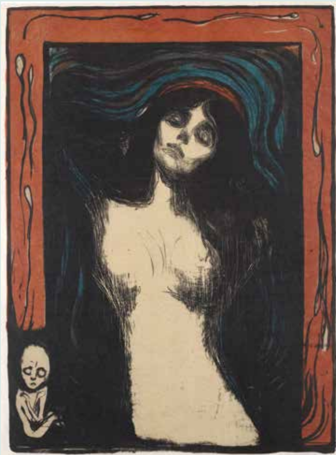
Edvard Munchs Lithografie „Madonna“ befindet sich in der Sammlung des Behnhauses.