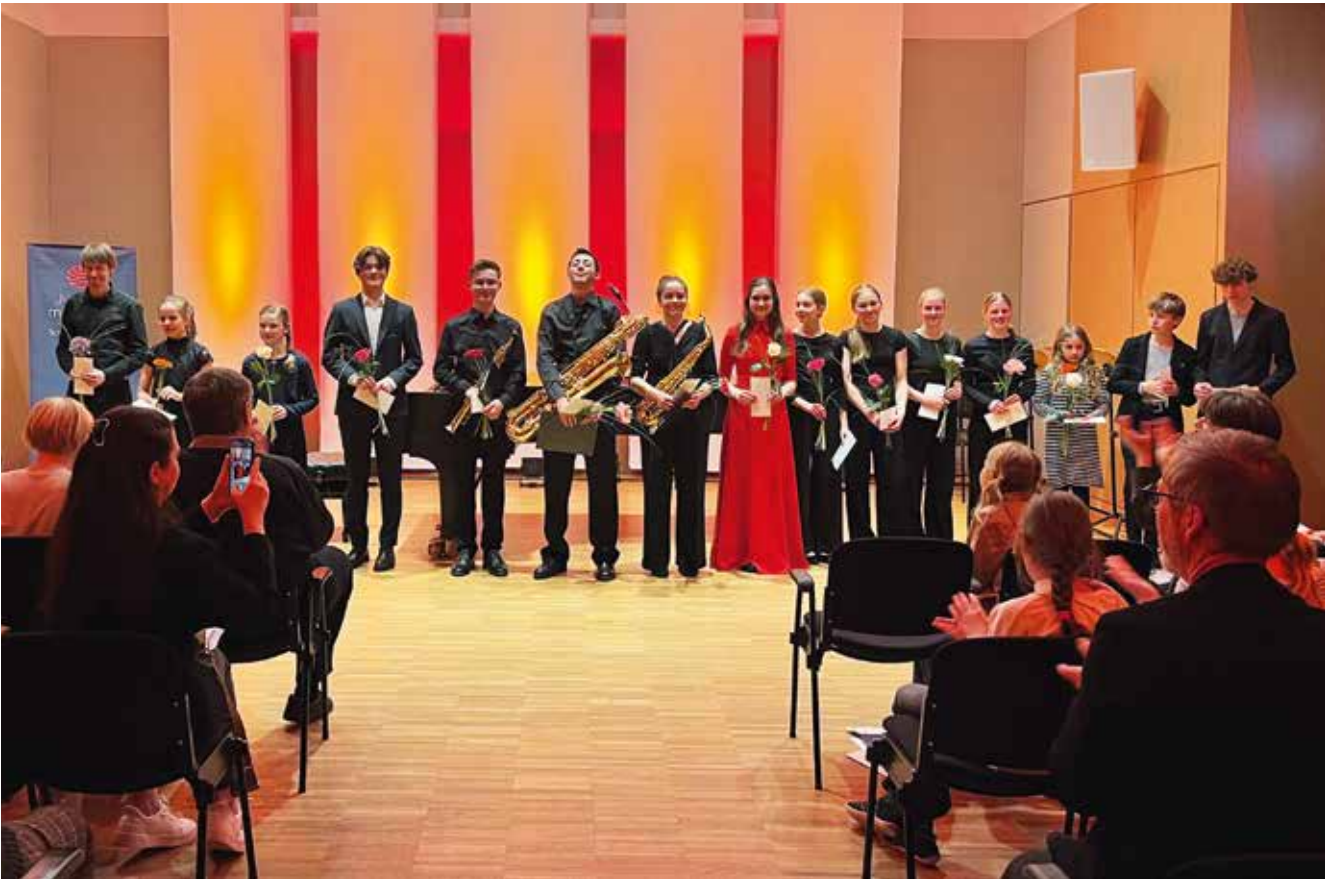
Die Nachwuchsmusiker konnten sich im Kleinen Saal der MuK über viel Applaus freuen.