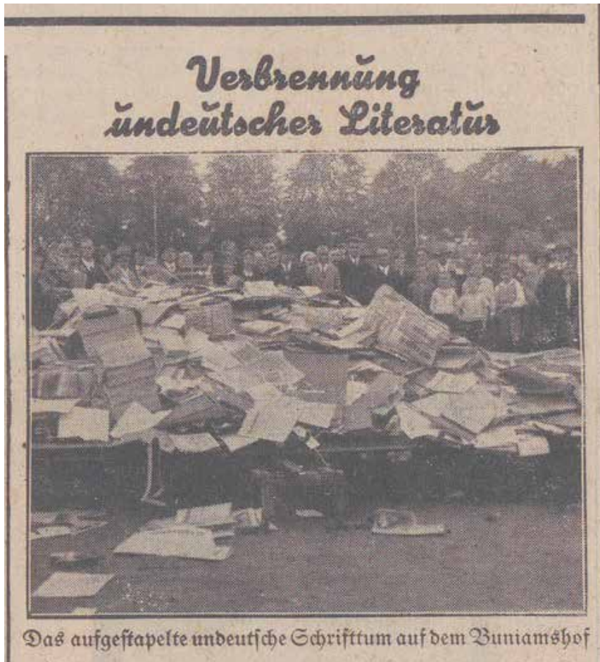
Am 29. Mai 1933 berichtete der Lübecker Volksbote über die Aktion auf dem Buniamshof. Weiteres Fotomaterial ist nicht bekannt.

Die nationalsozialistischen Bücherverbrennungen von 1933 gelten als Symbol des Terrors gegen Freiheit, Vielfalt und Kultur. Während der 10. Mai 1933 in Berlin als Zentraldatum gilt, fanden auch in anderen deutschen Städten inszenierte Verbrennungen statt – regional geprägt, zeitlich versetzt und mit unterschiedlichen organisatorischen Hintergründen. Die Lübecker Bücherverbrennung vom 26. Mai 1933 auf dem Buniamshof bietet ein aufschlussreiches Fallbeispiel für die Diskrepanz zwischen propagandistischem Anspruch und administrativer Realität im frühen Nationalsozialismus.