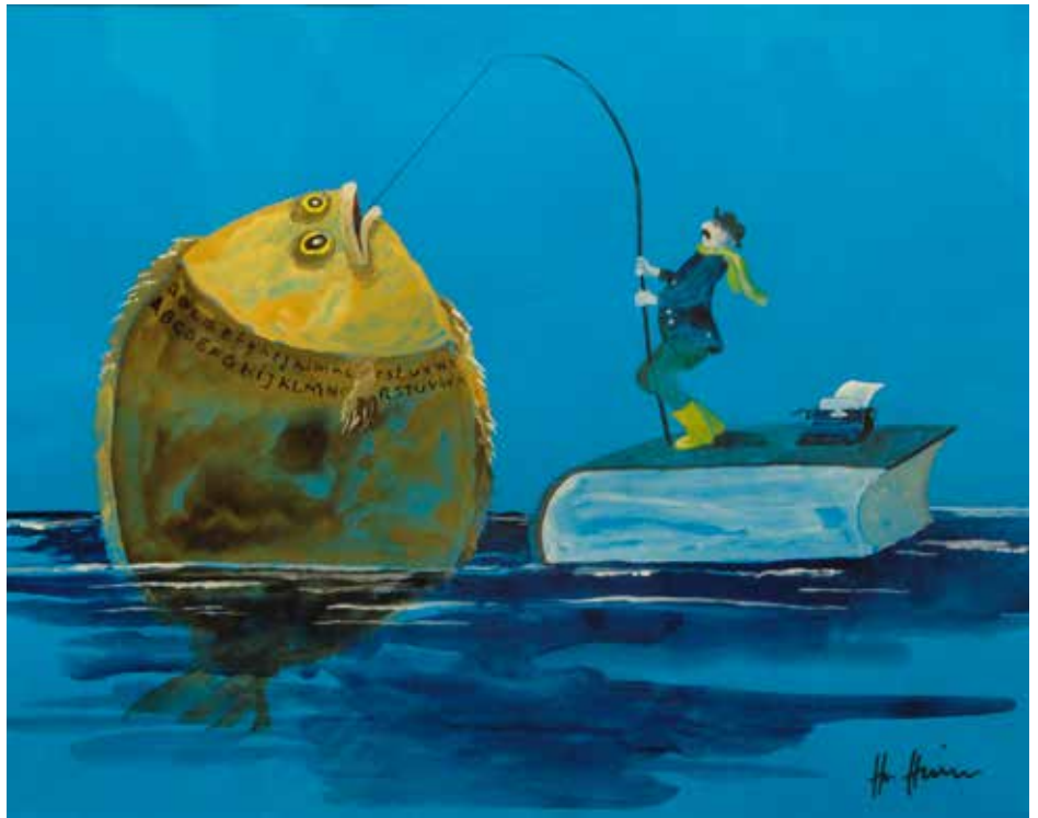
Helme Heine: „Der Butt am Haken“.

Zum Begleitprogramm der Ausstellung „Es war einmal...“ wird unter dem Titel „Philosophieren mit Kindern“ die Frage erörtert, was Freundschaft ist; und für das Junge Schauspiel Lübeck bringt Regisseur Sven Niemeyer den Bilderbuchklassiker von Helme Heine, „Freunde“, auf die Bühne. Karin Lubowski ●