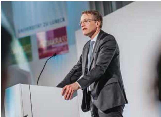
Ministerpräsident Daniel Günther beim Jahresempfang der Universität zu Lübeck.