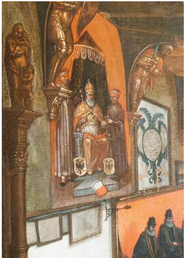
Ausschnitt aus dem Bild des Audienzsaals mit Kaiserdarstellung.