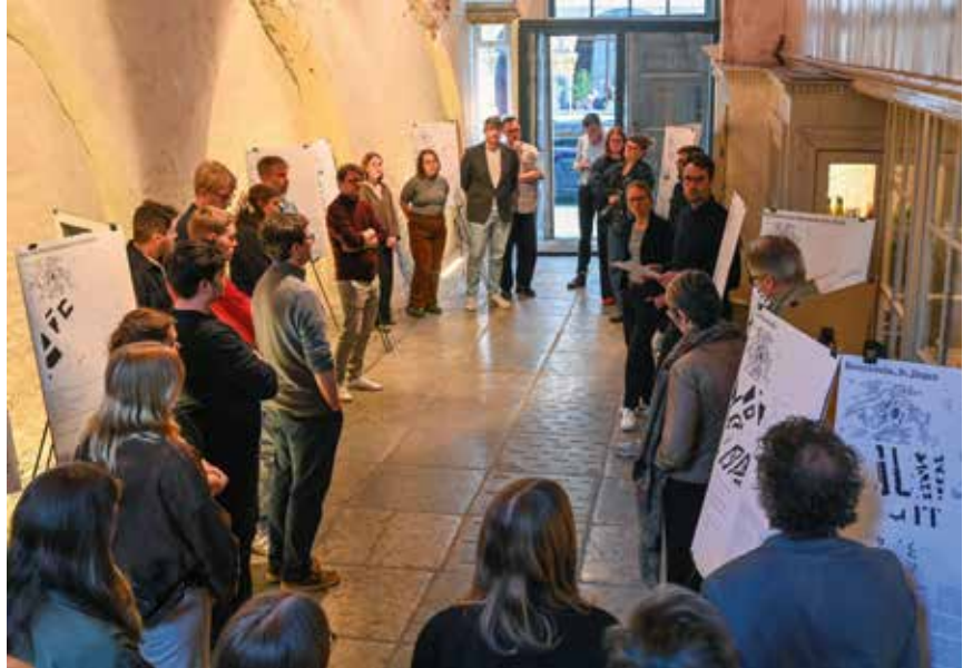
Während der Präsentation der Ausstellung, die durch TH-Studierende erarbeitet wurde.

Sehr konkret stellt sich die Frage von Abriss oder Sanierung und Weiterentwicklung aktuell beim Wohnblock Margarethenstraße 42-52. Während der Lübecker Bauverein eine Sanierung ablehnt und den Abriss beantragt hat,