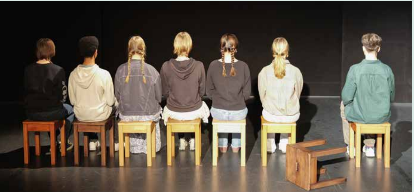
„Dunkelnacht“ erzählt eindrucksvoll von einem Verbrechen in den letzten Tagen des Zweiten Weltkriegs.