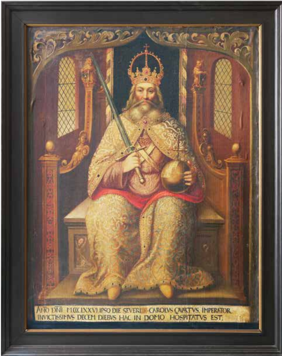
Das Ölgemälde mit der Darstellung von Kaiser Karl IV. aus dem Haus Königstraße 41 kam 1861 in die Kunstsammlung der Gemeinnützigen und wurde 1915 in das neue St. Annen-Museum überführt.

An einem Frühlingstag im Mai 2024 versammelte sich ein Kreis von Fachleuten zum Austausch um ein jüngst im Depot des Museums für Kunst und Kulturgeschichte entdecktes Tafelbild. Es misst knapp 170 cm in der Höhe und 140 cm in der Breite. Es zeigt Kaiser Karl IV. und trägt am unteren Rand die Inschrift: ANO DNI MCCCLXXVI IPSO DIE SEVERI CAROLUS QUARTUS IMPERATOR / INVICTISSIMUS DECEM DIEBUS HAC IN DOMUS HOSPITAUS EST, frei übersetzt: Im Jahr des Herrn 1376, am Tag des Severus, war Karl IV., der unbesiegte Kaiser, für zehn Tage in diesem Haus gastlich aufgenommen.