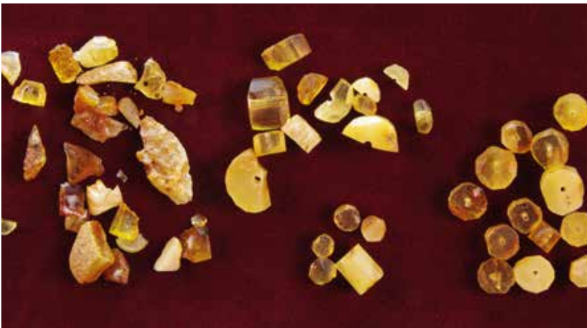
Rohmaterial, Perlenfragmente, geschnittene und vorgebohrte Perlenrohlinge aus der Kloake auf dem Grundstück in der Braunstraße.

Bei Eintragung Lübecks in die Liste des Weltkulturerbes der UNESCO wurde ausdrücklich auch die archäologische Forschung erwähnt. Ausgrabungen erbrachten neben wichtigen Erkenntnissen geschätzt rund drei Millionen Fundstücke. Rund 4000 Objekte konnten in den Jahren 2005 bis 2011 im Archäologischen Museum präsentiert werden, verschwanden dann aber wieder im Magazin des Bereichs Archäologie und Denkmalpflege der Hansestadt. In dieser Serie stellen wir ausgewählte Objekte vor, diesmal Bernsteinperlen aus dem Gründungsviertel.