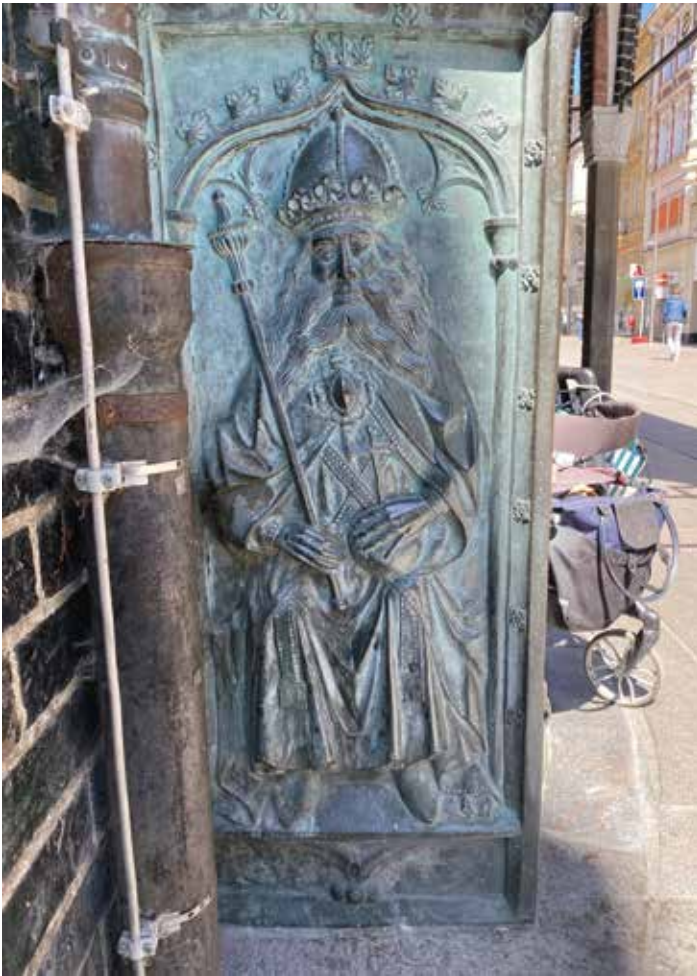
Die bronzene Beischlagwange mit Kaiserdarstellung von 1452 stand ursprünglich am Eingang zum Ratskeller, heute steht sie vor dem Haupteingang des Rathauses.

diente der Raum fahrenden Schauspielgruppen als Theater. Und das Kaiserbild scheint in diesem Raum seinen Platz gehabt zu haben. Der in der Mitte des 19. Jahrhunderts tätige Häusertopograph Hermann Schröder lokalisierte es in die Zeit um 1825 in der Diele und zitierte Wort für Wort die Inschrift.