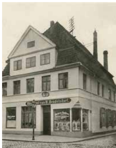
Dankwartsgrube 39/41, Bäckerei Bengelsdorf um 1910.