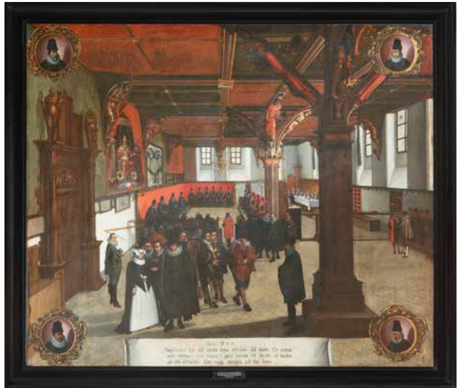
Hans von Hemßen malte den „Audienzsaal im Lübecker Rathaus vor der Erneuerung von 1573 mit Sitzung des Obergerichts“ um 1620.

Königstraße 41 war einst ein Doppelhaus mit spätromanischen Rückgiebeln. Man betrat es bis um 1800 rechts. Im Windfang öffnete sich linkerhand die breite Tür in einen Raum, der den vollen Umfang einer großen Diele hatte, gut 200 Quadratmeter. Die Zirkelgesellschaft traf sich dort zu innerstädtischen Versammlungen. Die Gesellschaft hatte sich im Zusammenhang mit dem Kaiserbesuch 1375 gegründet. Und in diesem Raum empfing Karl IV. am ersten Tag seines Besuches in Lübeck die Honoratioren der Stadt. Im frühen 18. Jahrhundert