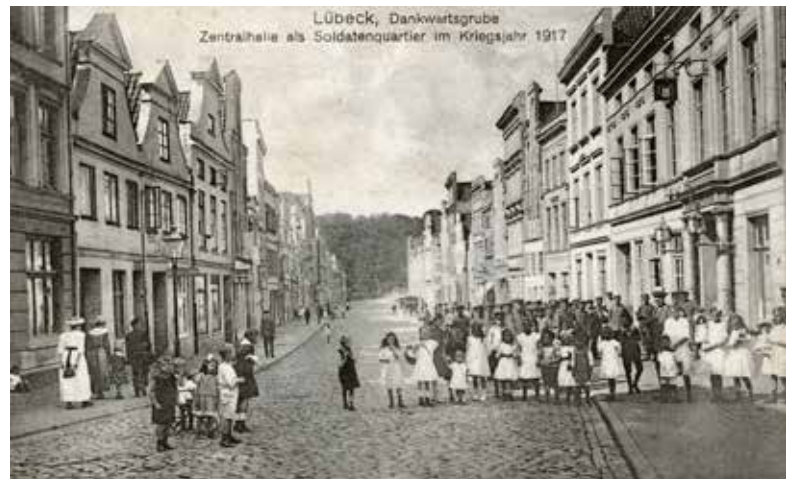
Die Dankwartsgrube im Kriegsjahr 1917, rechts die Zentralhalle(n).